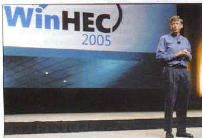
5. Bill Gates právě ohlašuje Windows XP Professional x64 Edition